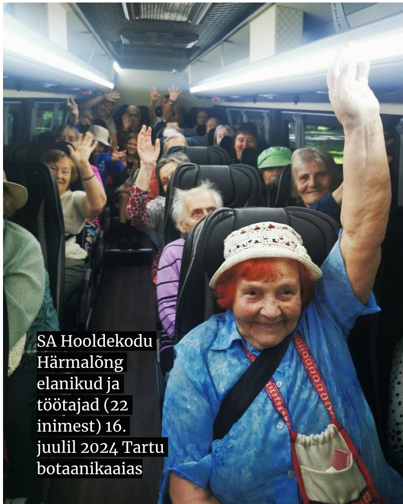
SA Hooldekodu Härmaalõng elanikud ja töötajad (22 inimest) 16. juulil 2024 Tartu botaanikaaias